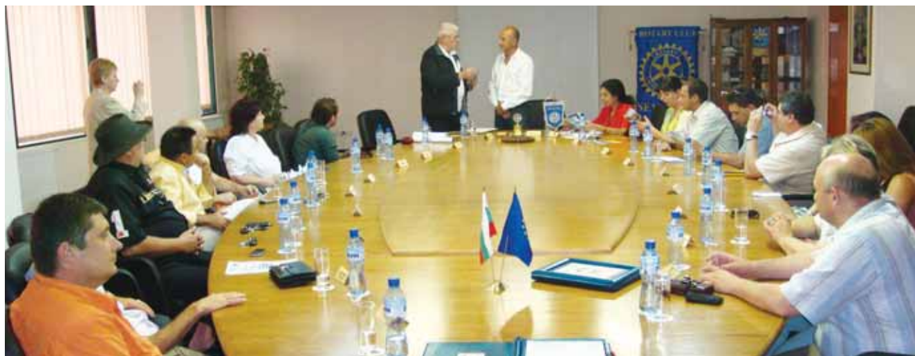
Членовете на Ротари клуб Севлиево и гостите от Аржентина