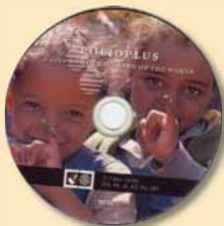
ПолиоПлюс: Дар за децата на света 317 $15

Решаването на проблемите е нещо, което ротарианците правят най-добре. Използвайте тези материали, за да помогнете на Ротари да удвои партньорската субсидия от фондация "Бил и Мелинда Гейтс" и да спази обещанието си да освободи света от полиомиелита. За да научите повече или да направите дарение, посетете www.rotary.org/endpolio .