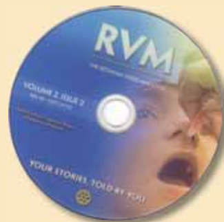
Видеосписание The Rotarian, DVD 506-06 $15

CD версия на книгата на члена на Международния комитет "ПолиоПлюс" и паст генерален секретар на РИ Хърбърт А. Пигман. Представя кратка история на ПолиоПлюс