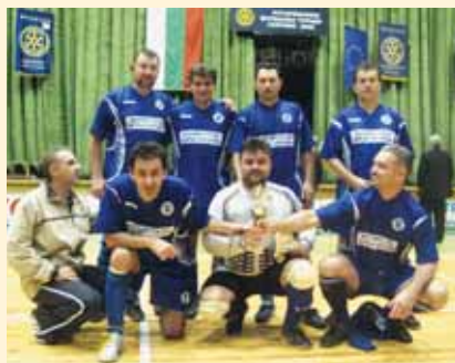
Отборът победител от РК София-Витоша