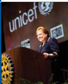
Ан Венеман през конгреса на Ротари в Лос Анджелис, 2008 г.

Директорката на УНИЦЕФ е убедена, че премахването на полиомиелита е възможно