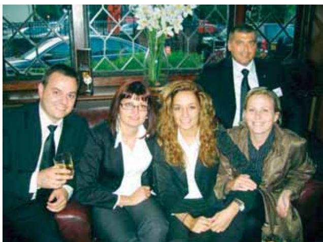
Участниците в Group Study Exchange са изключително доволни след поредния ден в Лондон

Целта на програмата Group Study Exchange е участниците в нея да придобият по-добра представа за посещаваната държава, за нейната история, култура, образование, политическа система и не на последно място - информация в конкретната професионална насока.