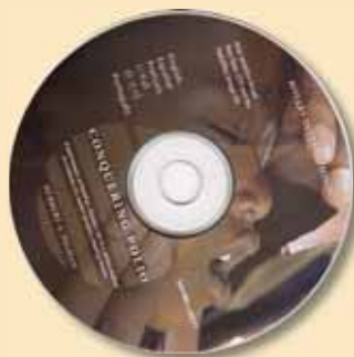
Да победим полиомиелита, CD 329 $5

Споделете успеха на Ротари в глобалната борба срещу полиомиелита с този кратък филм, проследяващ усилията ни да премахнем болестта