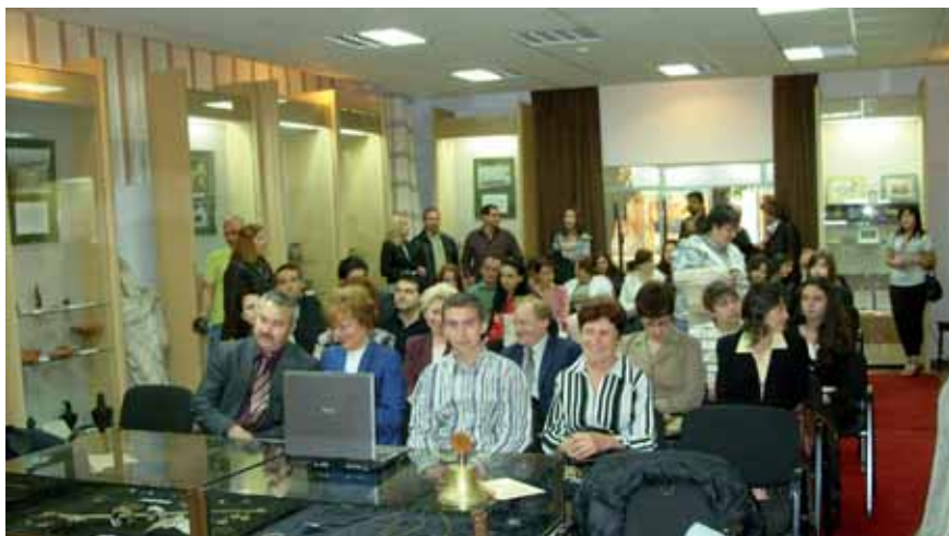
Нашите гости в Експозиционната зала на РИМ Монтана

Партньори в популяризирането на конкурса са приятелите от montana-news.com; в-к "Монт прес" и в-к "Северозапад прес"; Общин-